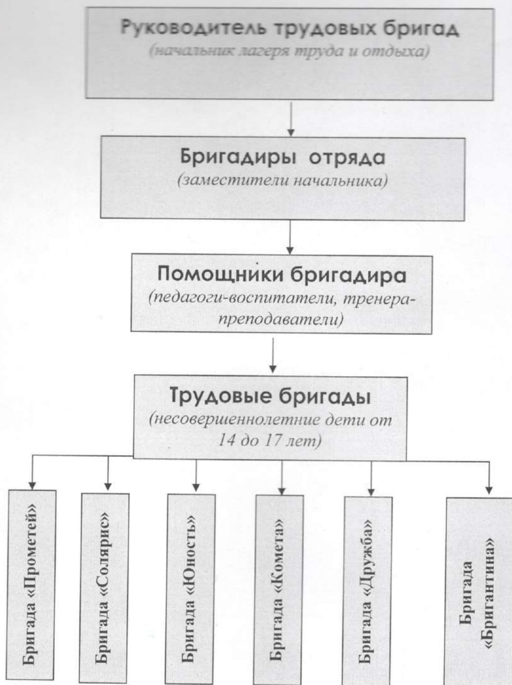
Схема соуправления Лагерь труда и отдыха «РЖПМ - 2025»